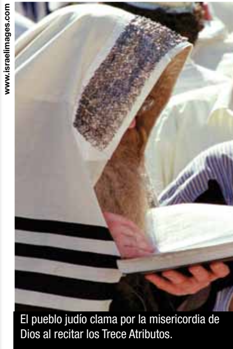
El pueblo judío clama por la misericordia de Dios al recitar los Trece Atributos.

Comenzamos este estudio con la cita de Yeshúa refiriéndose al Shemá (“Escucha, Israel; el Señor nuestro Dios, el Señor uno es”). Esa es la creencia central del judaísmo de que existe un solo Dios. El valor numérico de ejad (uno) y ahavá (amor) es de 13 cada uno. Juntos, suman a 26. Ahora, considere lo siguiente: las letras YHVH, el nombre de Dios, tienen un valor numérico de 26! Dios es amor y es Uno solo, y su nombre es YHVH.