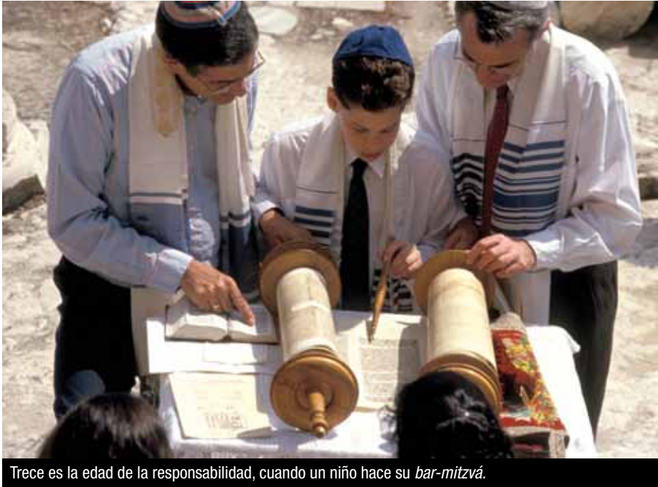
Trece es la edad de la responsabilidad, cuando un niño hace su bar-mitzvá .