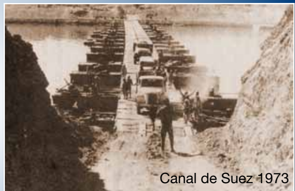
Canal de Suez 1973