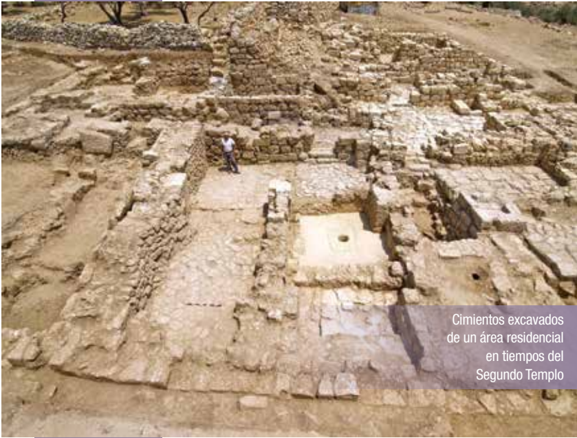
Cimientos excavados de un área residencial en tiempos del Segundo Templo

CUANDO TRAEMOS A CRISTIANOS PARA visitar a Israel, hay ciertos lugares a donde siempre los llevamos a ver. Eso incluye el Mar de Galilea, el Río Jordán, Capernaúm, el Mar Muerto, el sector judío de la Ciudad Antigua de Jerusalén y el Muro Occidental ( Kotel ). Pero uno de los lugares más destacados en esa lista es el área arqueológico del Monte del Templo. Los escombros en esa asombrosa excavación son producto de la destrucción del Templo, y se observa un pavimento herodiano midiendo 13 metros (43 pies) de ancho en que Yeshúa (Jesús) mismo pudo haber caminado. Igualmente impresionantes son las masivas piedras herodianas que forman parte del cimiento y base del Muro. Algunas de esas piedras miden 10 metros (33 pies) de largo, 1 metro (3.2 pies) de alto y 1.5 metros (5 pies) de ancho, y pesan unas 50 a 100 toneladas. Arqueólogos del Monte del Templo han encontrado otras piedras aún más grandes. La página de Internet BibleWalks.com dice: “La destrucción en 70 d.C., luego de la revuelta judía contra los romanos, dejó la mayoría del segundo Templo de Herodes en escombros. Sólo algunos restos de esa impresionante estructura han permanecido, como [porción del] Muro Occidental, la Puerta Hulda y la esquina suroeste del muro sureño.”