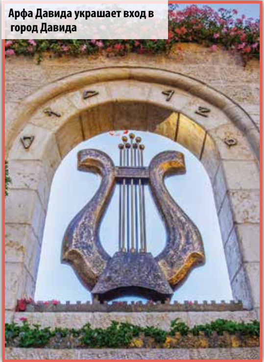
Арфа Давида украшает вход в город Давида

Иерусалим также описывается под другим названием,- Сион (2 Царств 5:7), которое появляется 176 раз в еврейских Писаниях и семь раз в Посланиях