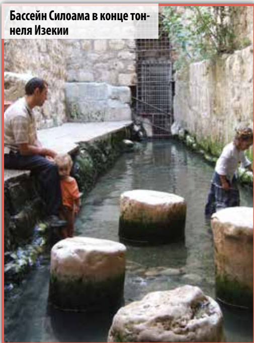
Бассейн Силоама в конце тоннеля Езекии

Чтобы сдерживать, хранить и защищать воды Гиона, в разное время были построены три подземные системы снабжения. Первой системой был тоннель, известный как «Шахта Уорренса», который позволял жителям древнего Иерусалима получать доступ к воде из источника Гион. Второй системой был Силоамский канал, «который направлял воду вдоль основания восточного склона города Давида. Часть канала имела форму выдолбленного в скале тоннеля, а другая его часть имела вид открытого канала снаружи стены, обеспечивая полив близлежащих сельскохозяйственных участков в долине Кедрон через специальные выходы».