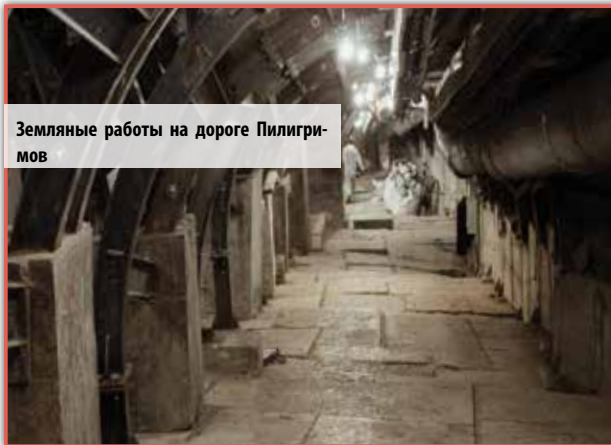
Земляные работы на дороге Пилигримов

Недавно лидеры «Мостов мира» посетили город Давида и были проведены по Пути пилигримов. Мы удивлялись, когда шли по каменным плитам, которым не менее 2000 лет,- по тем же самым плитам, по которым путешествовали Иисус, Его ученики и бесчисленное множество других евреев, когда они поднимались из Силоамского бассейна в Храм.