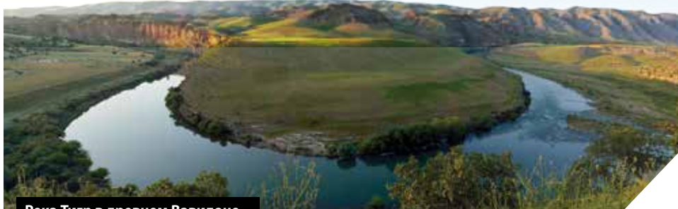
Река Тигр в древнем Вавилоне

од, предшествующий вавилонскому завоеванию. Он был отправлен в изгнание в то же время, что и царь Иехония - в 598-597 гг. до н.э. Он был пророком в изгнании. Он находился в Вавилоне, когда были разрушены Иерусалим и Храм Божий. Бог использовал его для предупреждения об опасности, призыва народа к покаянию, и после разрушения Иерусалима он говорил слова утешения и будущей надежды еврейскому народу, находившемуся в изгнании. В Книге Псалмов мы видим эмоциональное состояние изгнанников: « При реках Вавилона, там сидели мы и плакали, когда вспоминали о Сионе » (Пс.136:1).