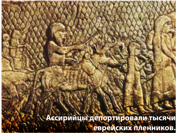
Ассирийцы депортировали тысячи еврейских пленников.

В 586 г до НЭ Храм был разрушен, и южное царство Иудеи было захвачено вавилонянами. Многие были отправлены в изгнание.