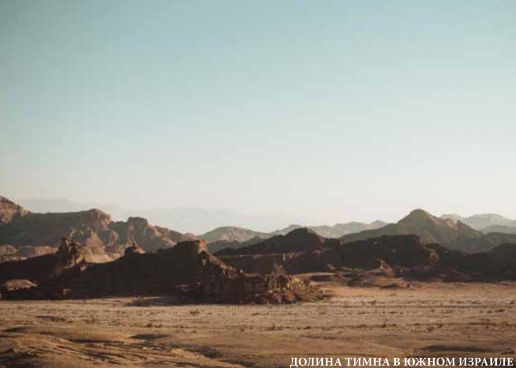
ДОЛИНА ТИМНА В ЮЖНОМ ИЗРАИЛЕ

Авраам покинул свой дом, чтобы отправиться туда, куда Бог призвал его, не только из-за теологической веры. У него была встреча с Богом, которая глубоко повлияла на него. Почти 40 лет назад мы с мужем получили подобный призыв от Бога. Мы знали, что он призывает нас в землю Израиля. Мы не смогли бы сделать этого, если бы не было глубокого понимания в нашей душе, что Бог абсолютно надежен, верен и истинен. Он - наша опора, и от Него мы питаемся. Я думаю, что у Авраама был подобный опыт. Он покинул дом, семью, обычаи и все, что знал, доверившись единственному истинному Богу, Который никогда не подведет. Мы, подобно Аврааму, предали себя Ему - Царю, Творцу, Искупителю - Единому Богу.