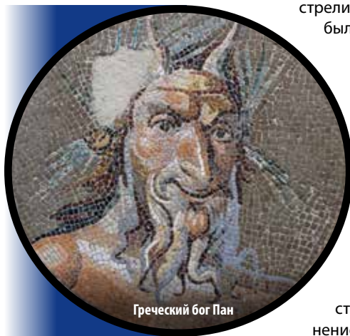
Греческий бог Пан

Я верю, что в определенный момент, благодаря той божественной искре, которая присутствовала глубоко внутри еврейского народа, люди, живущие вокруг них в то время (как и сейчас), услышали истину того послания, которое еврейский народ должен был принести всему миру. И, поскольку они услышали ее, им надо было решать, что делать с ней. Если они не желали принять ее, им необходимо было обойтись с ней как-то по-другому. В Америке есть поговорка: «Застрели, принесшего весть». И, к сожалению, был выбран именно такой путь.