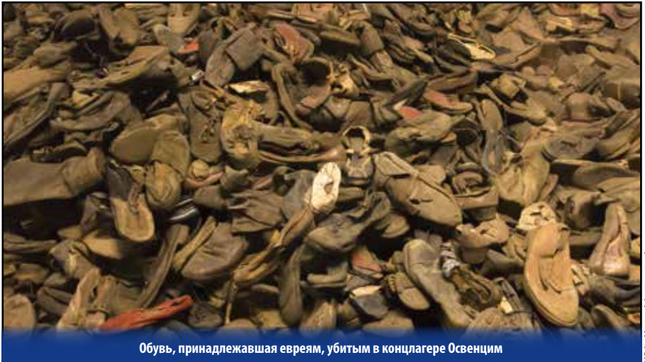
Обувь, принадлежавшая евреям, убитым в концлагере Освенцим

4. Заблуждение – Удивительно, но во всем мире существует прелестное «маленькое» соглашение по поводу того, почему евреев ненавидят. Деньги, земля, власть, нужда в трудоустройстве – эти типичные оправдания для гонений и угнетения народа, существующие в веках, исторически не имеют ничего общего со всемирной ненавистью к еврейскому народу, продолжающейся тысячелетиями.