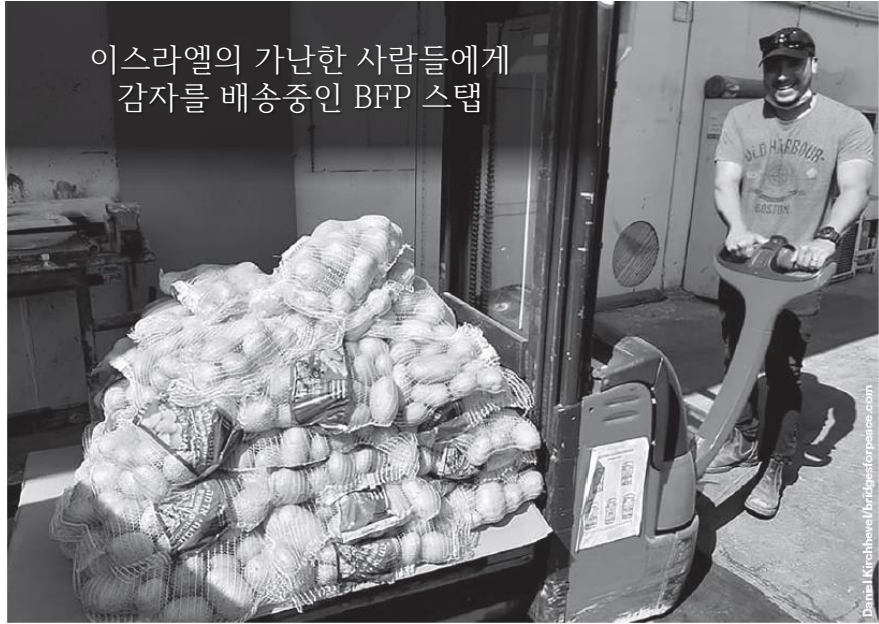
이스라엘의 가난한 사람들에게 감자를 배송중인 BFP 스태프

새로운 요청이 계속해서 들어오고 있습니다. 최근에는 750명의 홀로 코스트 생존자들을 도와달라는 요청을 받았습니다. 저는 그들을 돕기 위해 예산을 조정할 수 있는 방법을 찾을 수 있기를 바랍니다. 이미 너무 많은 고난의 세월을 겪은 분들이기에, 저는 그들에게 도와줄 수 없다고 말할길 원치 않습니다.